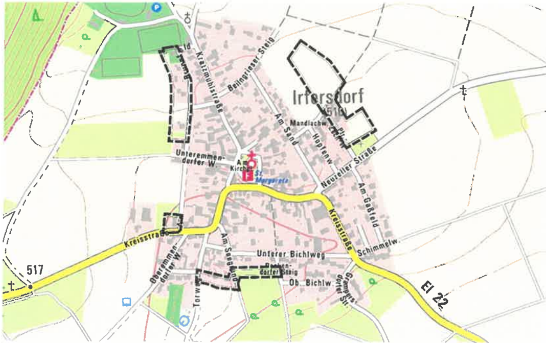
Lageplan des räumlichen Geltungsbereiches der 33. Änderung des Flächennutzungsplans o. M., (Kartengrundlage Geobasisdaten © Bayerische Vermessungsverwaltung 2022)