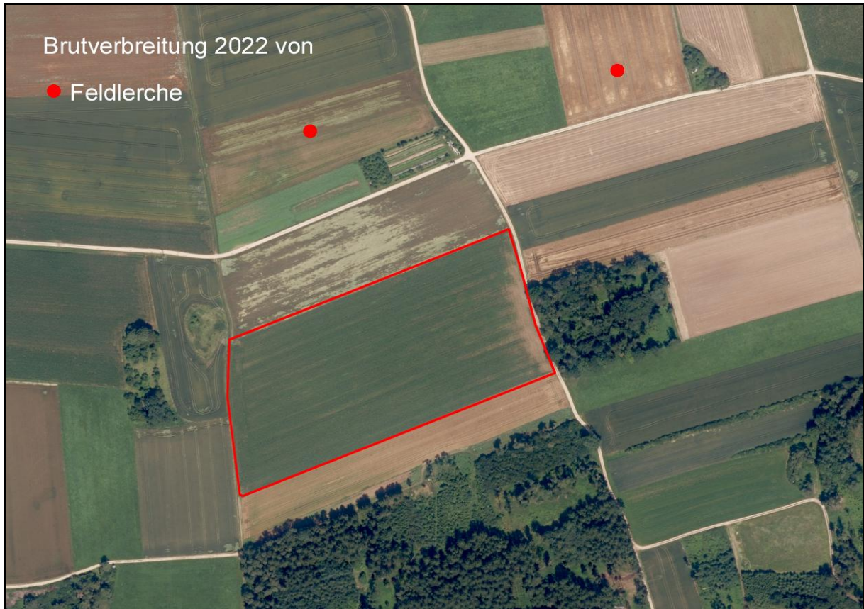
Abbildung 2: Brutverbreitung der Feldlerche im Umfeld des geplanten Solarparks

weniger großen Abstand einhalten. Auf die anderen nachgewiesenen Brutvogelarten im Umfeld sowie die Nahrungsgäste, Mäusebussard, Rabenkrähe, Turmfalke, Schwarzmilan und Rotmilan gehen keine erheblichen Beeinträchtigungen aus, da deren lokale Bestände nicht bedroht sind, keine Störungen wirksam werden bzw. keine entscheidenden Nahrungshabitate verloren gehen.