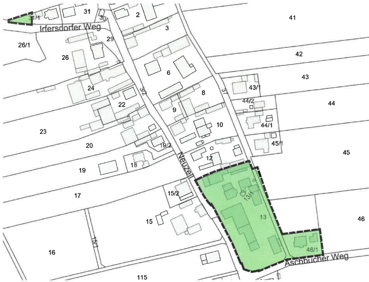
Lageplan des räumlichen Geltungsbereiches der 54. Änderung des Flächennutzungsplans o. M., (Kartengrundlage Geobasisdaten © Bayerische Vermessungsverwaltung 2022)