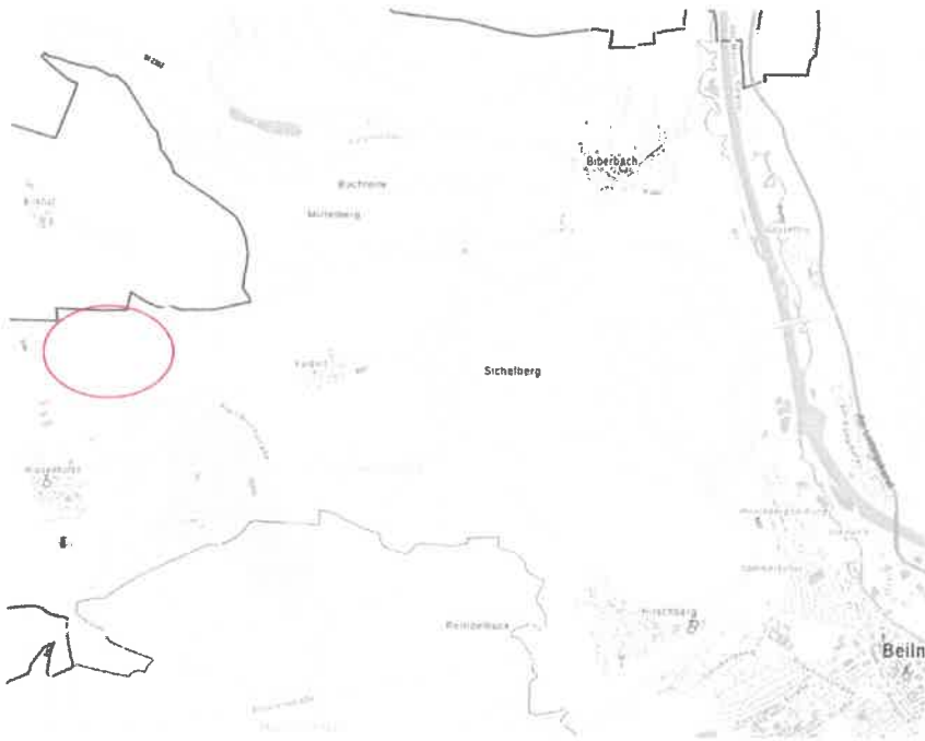
Lageplan räumliche Einordnung des Geltungsbereiches des Bebauungsplans o. M., (Kartengrundlage Geobasisdaten © Bayerische Vermessungsverwaltung 2022)

abgeben, erhalten Sie keine Mitteilung über das Ergebnis der Prüfung. Weitere Informationen entnehmen Sie bitte dem Formblatt „Datenschutzrechtliche Informationspflichten im Bauleitplanverfahren“ das ebenfalls öffentlich ausliegt.