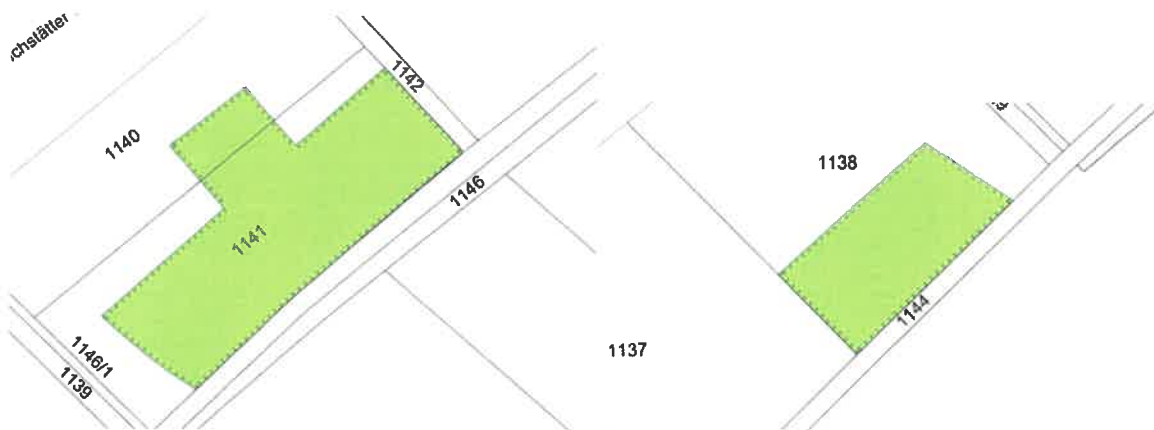
Links: Lageplan des räumlichen Geltungsbereichs der 2. Ausgleichsfläche Teilflächen der Fl.st. Nrn. 1083, 1140 und 1141 Gmkg. Beilngries o.M. Rechts: Lageplan des räumlichen Geltungsbereichs der 3. Ausgleichsfläche. Teilfläche der Fl.st. Nr. 1138 Gmkg. Beilngries o.M., (Kartengrundlage Geobasisdaten © Bayerische Vermessungsverwaltung 2021)