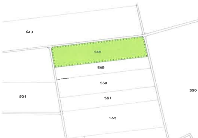
Lageplan des räumlichen Geltungsbereichs der 4. Ausgleichsfläche. Fl.st. Nr. 548 Gmkg. Töging o.M., (Kartengrundlage Geobasisdaten © Bayerische Vermessungsverwaltung 2021)