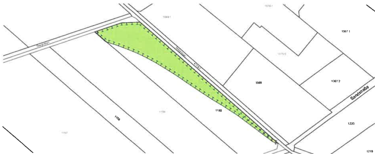
Lageplan des räumlichen Geltungsbereichs der 1. Ausgleichsfläche. Teilflächen der Fl.st. Nrn. 1159 und 1160 Gmkg. Beilngries o. M., (Kartengrundlage Geobasisdaten © Bayerische Vermessungsverwaltung 2021)