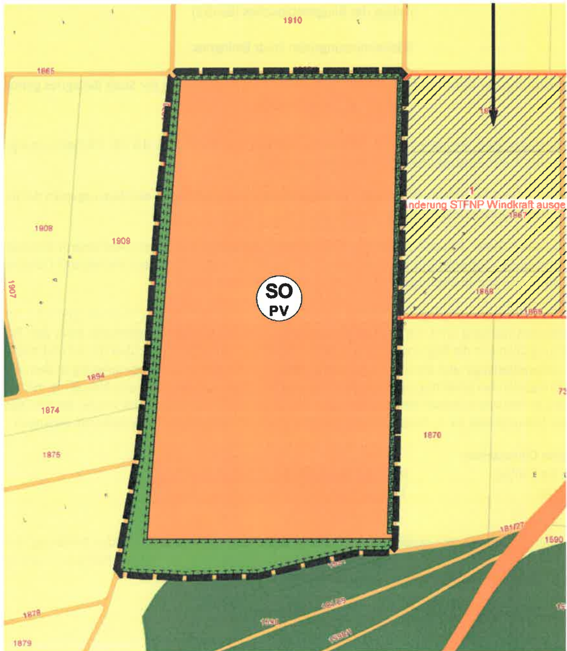
Lageplan des räumlichen Geltungsbereiches der 46. Änderung des Flächennutzungsplans o. M., (Kartengrundlage Geobasisdaten © Bayerische Vermessungsverwaltung 2022)